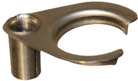
Rys. 3 Obsada tygla