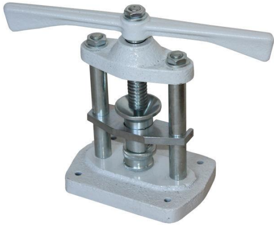
Rys. 2 Pastylarka