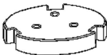
Rys. 5 Pierścień-statyw bomby

Oczyścić bombę kalorymetryczną, spłukać wodą destylowaną i osuszyć ściereczką.