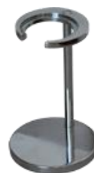
Rys. 6 Statyw głowicy bomby